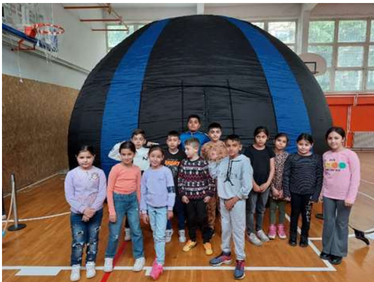
Слика 8. Наши ученици

Наши ученици, који су посетили планетаријум, задовољни су предавањем и радују се продубљивању знања из Астрономије.